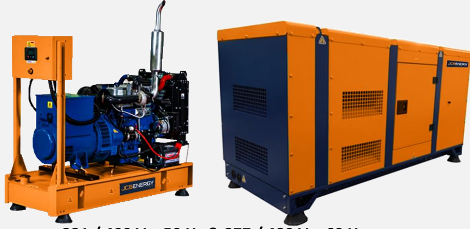
231 / 400 V – 50 Hz & 277 / 480 V – 60 Hz