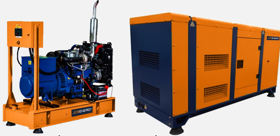
231 / 400 V – 50 Hz & 277 / 480 V – 60 Hz