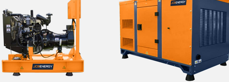
231 / 400 V – 50 Hz