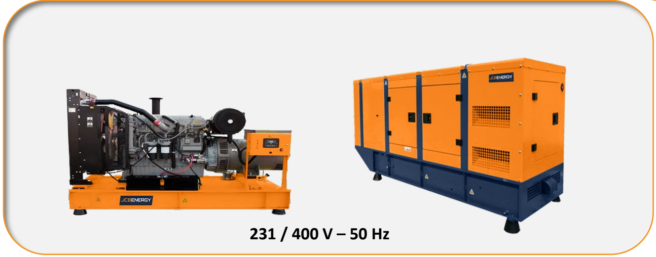
231 / 400 V – 50 Hz