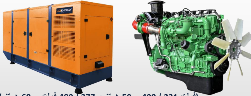
(فولت 231 / 400 - 50 هرتز و 277 / 480 فولت - 60 هرتز)