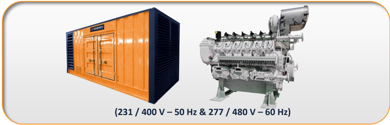
(231 / 400 V – 50 Hz & 277 / 480 V – 60 Hz)